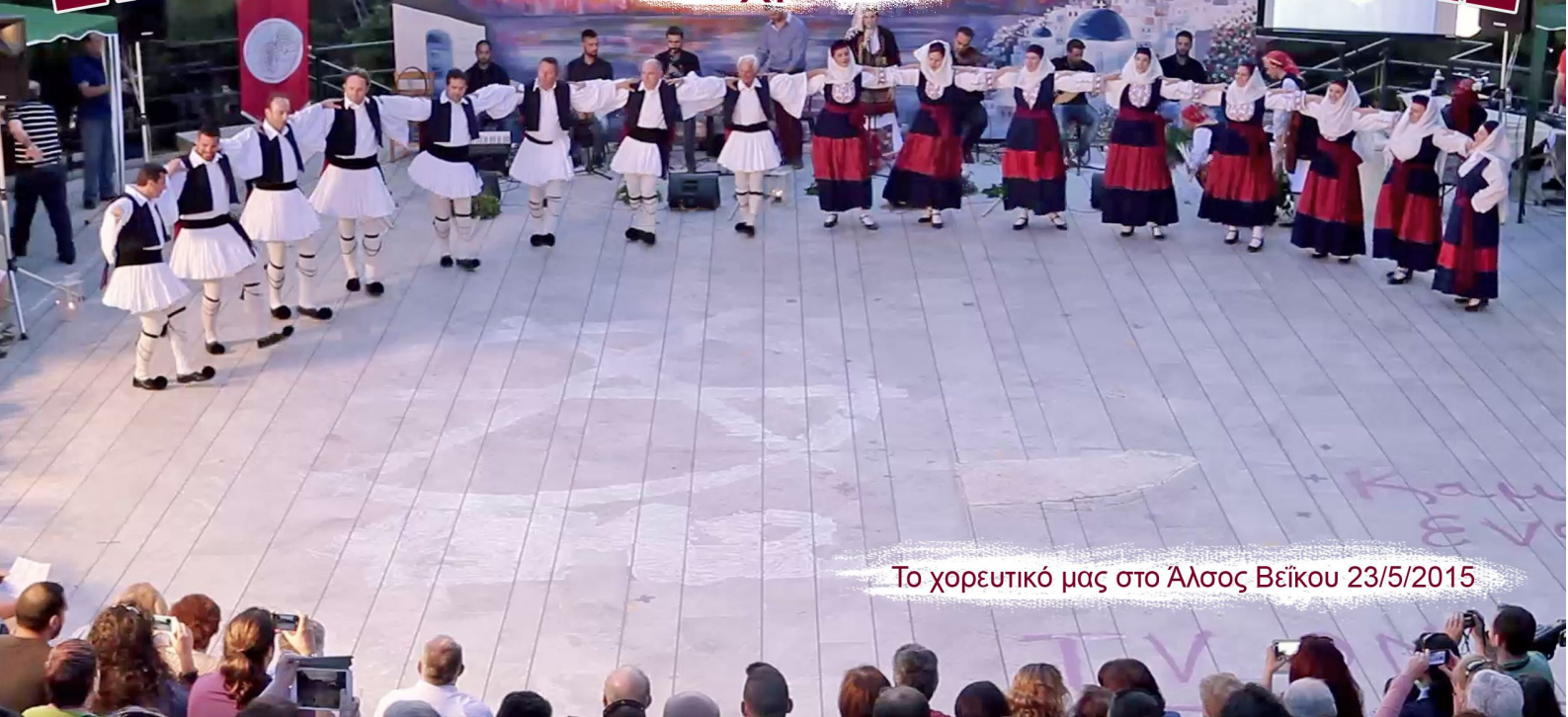
Το χορευτικό μας στο Άλσος Βεΐκου 23/5/2015