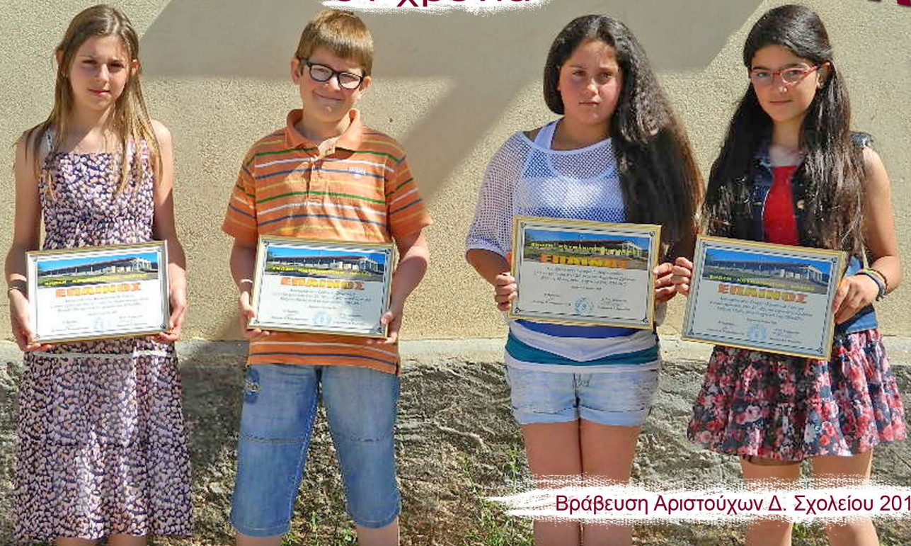
Βράβευση Αριστούχων Δ. Σχολείου 2015